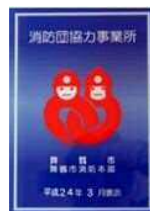
「消防団協力事業所表示証」