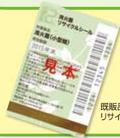
既販品消火器 リサイクルシール